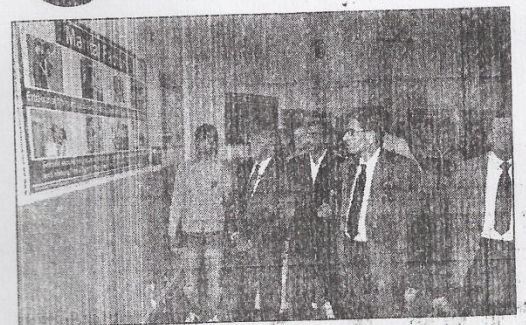
हिसार। प्रदर्शनी का अवलीकन करते गुजवि के कुलपति हा. एमप्रेन रंगा व अन्य।