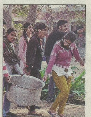
हिसार : कैमरी गांव में एनएसएस शिविर के तहत जागरूकता रैली निकालते विद्यार्थी।