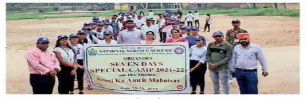
हिसार। जीजेयू के एनएसएस शिविर के दौरान मौजूद छात्र एवं छात्राएं।

जीजेयू में एनएसएस के सात दिवसीय शिविर का चौथा दिन